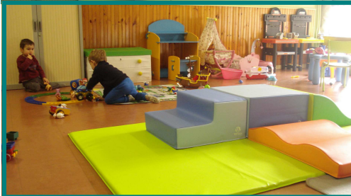
Atelier à Barjols en février