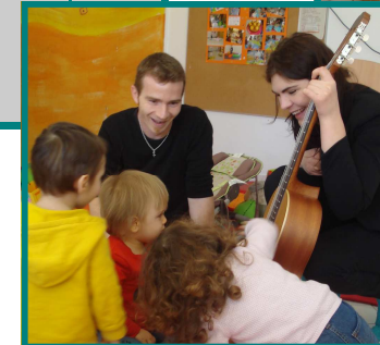
Atelier musical à Seillons en février