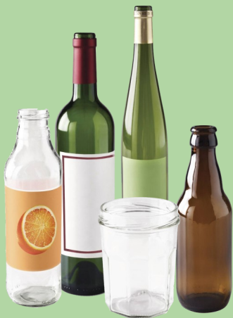
Bouteilles, pots et bocaux en verre