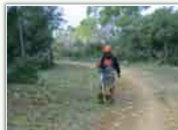
En pleine action