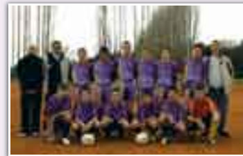
Les 13 ans, équipe 1 lors du match Barjols / La Crau, 21/01/07