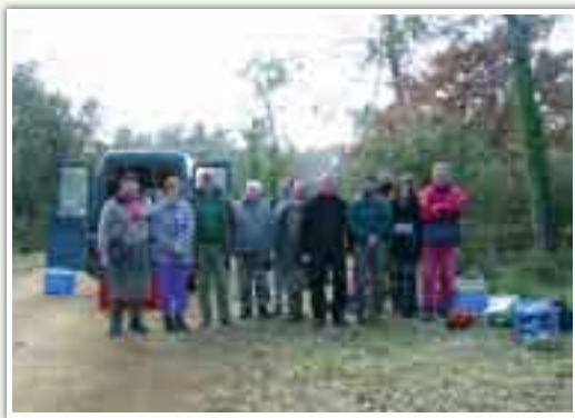
L'équipe du chantier Vega accompagnée des deux encadrants de l'O.N.F. à Barjols

Ces modules se clôturent par l'obtention d'un certificat qui valide les acquis de chaque formation suivie. Début janvier 2007, l'équipe a validé son brevet de secouriste du travail.