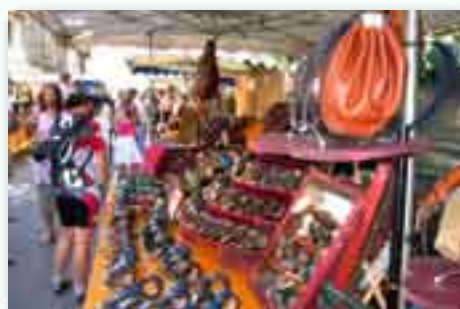
Foire du cuir

En 2005, nous avons soutenu les associations agissant dans un intérêt intercommunal avec plus de 50 000 € de subvention allouées par la Communauté de communes.