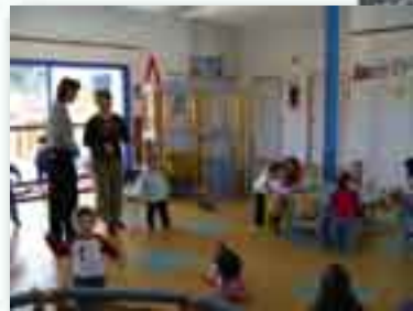
Crèche Les Pitous