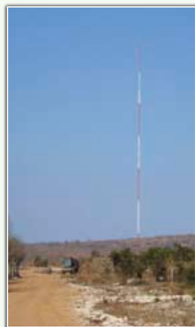
Le mât de mesure