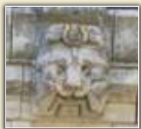
Un des mascarons de la corniche du château